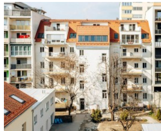
Strauchergasse: Das Gründerzeithaus ist bezugsfertig. Silver Living

Im Zuge der Renovierung habe man außerdem darauf geachtet, nicht nur modernes Wohnen zu ermöglichen, sondern auch die historischen Merkmale des Objekts zu erhalten, betont Trummer. So bezeugen immer noch die eleganten Treppengeländer, die etwa Mitte des 19. Jahrhunderts entstanden, von der langen Geschichte