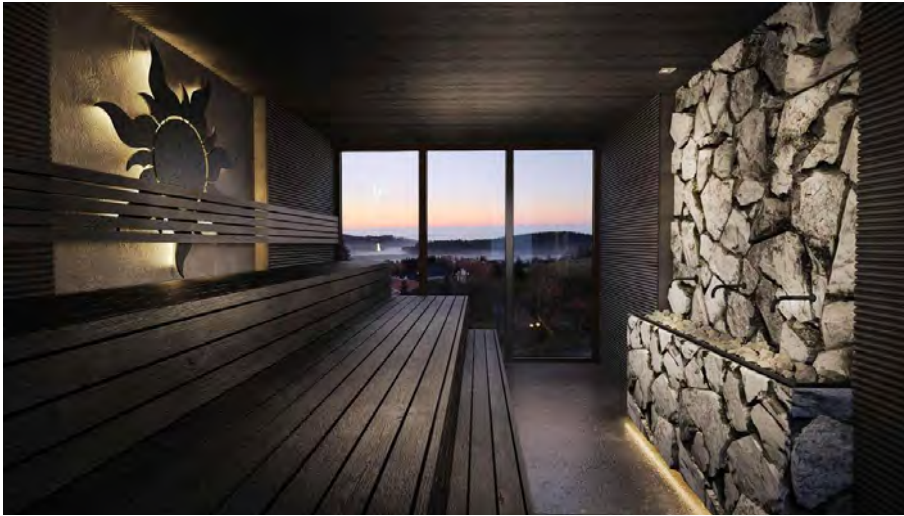
Krafttanken im Bayerischen Wald