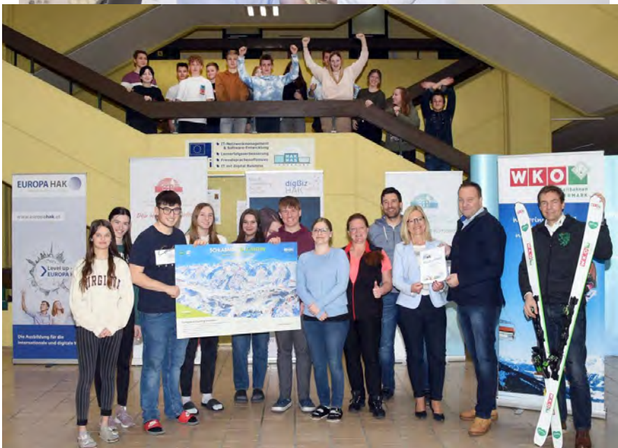
Erster österreichischer Schulskitag