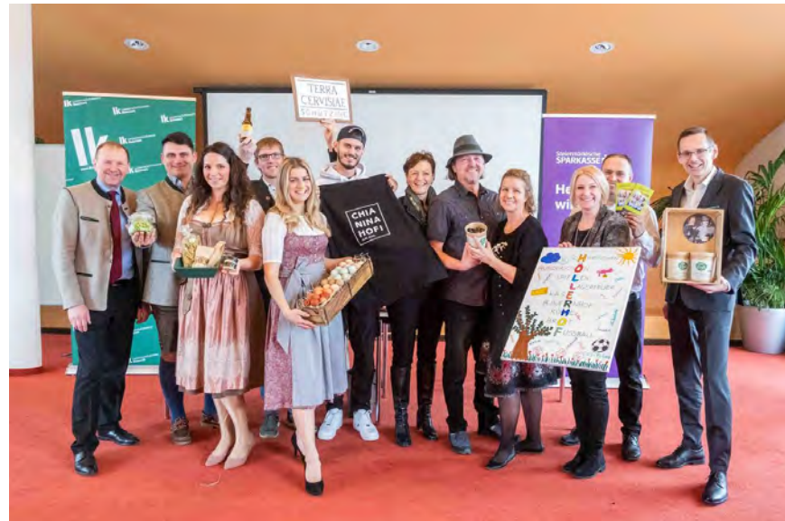
Die „Vifzacks“ der Landwirtschaft