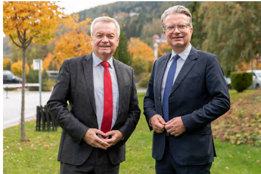
POLITIK. Gutes Zeugnis für die Landesfinanzen