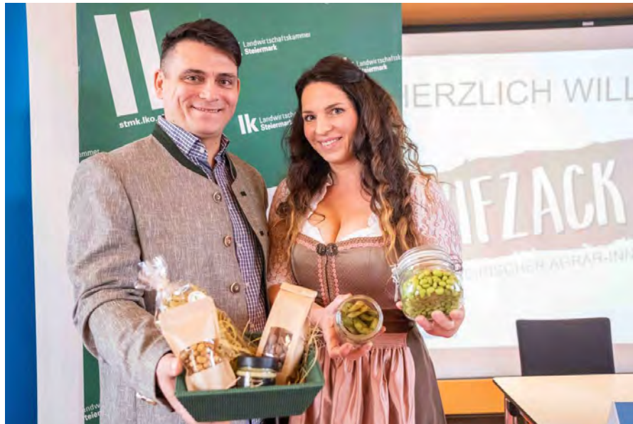
SUPERFOOD: Edamame aus der Oststeiermark