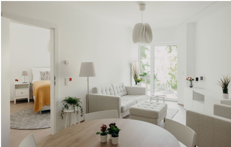
Wohnung (Einrichtung beispielhaft und nicht Teil der Ausstattung)